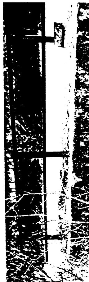
Schematický náčrt mostu, převzatý z ML, 1.část